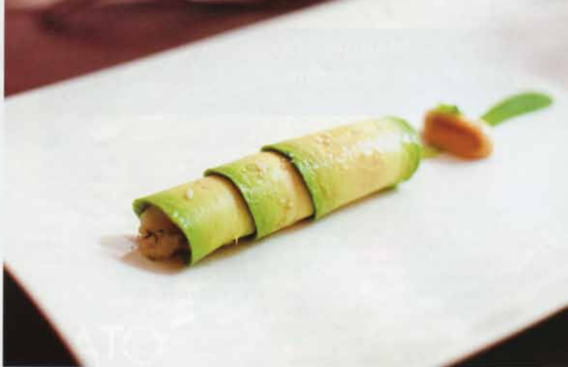
FLAUTAS DE AGUACATE RELLENAS DE CAMARÓN CRISTAL, MAYONESA DE CHIPOTLE RALLADO Y EMULSIÓN DE CILANTRO.